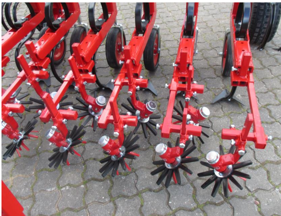
Obr. 1 Paprsková kola s hroty [8]

Tento typ pleček je nejužívanějším typem. Nepoháněné plečky vykonávají svoji činnost pouze díky pojezdu tažného prostředku. Nástroje pro pletí jsou většinou šípové radličky s elevačním úhlem 15^\circ a jednostranné radličky se skloněnými křídly o 30^\circ až 40^\circ od směru pojezdu [3]. Dále jsou jako nástroje používána dláta [5] či pruty [3]. Pruty jsou montovány na rám, který může být k nosnému rámu spojen pevně [6] nebo volně za pomoci zavěšení na řetězy [7]. Zavěšení na řetězy umožňuje větší stranový pohyb v případě nutnosti. Nepoháněné plečky mohou být opatřeny také rotačními segmenty. Tyto segmenty jsou poháněny odvalováním od povrchu půdy při jízdě tažného prostředku. Rotačními segmenty mohou být lopatková [3] nebo paprsková kola s hroty [8] (Obr. 1).