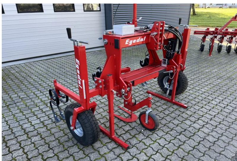
Obr. 5 Přesné autonomní jemné řízení [14]

V současnosti byl vyvinut i systém autonomního přesného jemného řízení. Někdy je nazýváno také jako precizní řízení. Ovladač je volně uloŕen v čepu a je umístĕn v meziřádkovém prostoru (viz Obr. 5). Na přední stranĕ ovladače je umístĕn elektrický senzor, který je spojen s řídící jednotkou a servomotorem pohybu. Při naráŕení ovladače senzor snímá smĕr pohybu a vysílá signál do řídící jednotky, která pohybuje přes servomotor rámem tříbodového závĕsu uloŕeného ve volném spojení (vymezovače pohybu) s rámem, na němŕ je umístĕno nářadí. Řízení je možno zpřesnit navádĕcím GPS systĕmem [14].