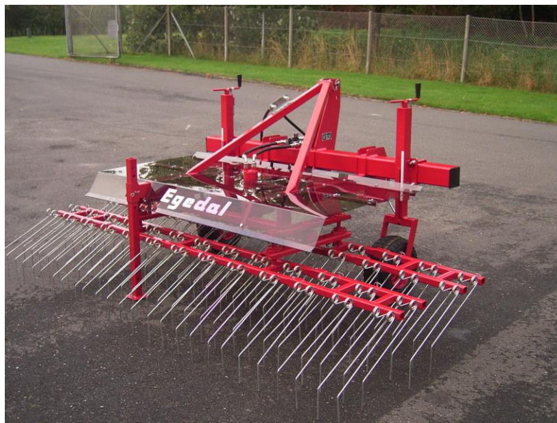
Obr. 3 Poháněná plečka s kmitajícími pruty [13]

Druhá skupina poháněných pleček využívá kmitající pracovní nástroje. Pracovním nástrojem mohou být vertikálně uložené hroty (někdy nazývány prsty) [13]. Každý z hrotů při pohybu opisuje vymezenou část kružnice tam a zpět. Dále jsou používány jako nástroje pruty, které jsou připevněny na dva dvojité rámy spojené vahadlem mezi sebou (Obr. 3). Vahadlo je pak poháněno excentrem a hydromotorem.