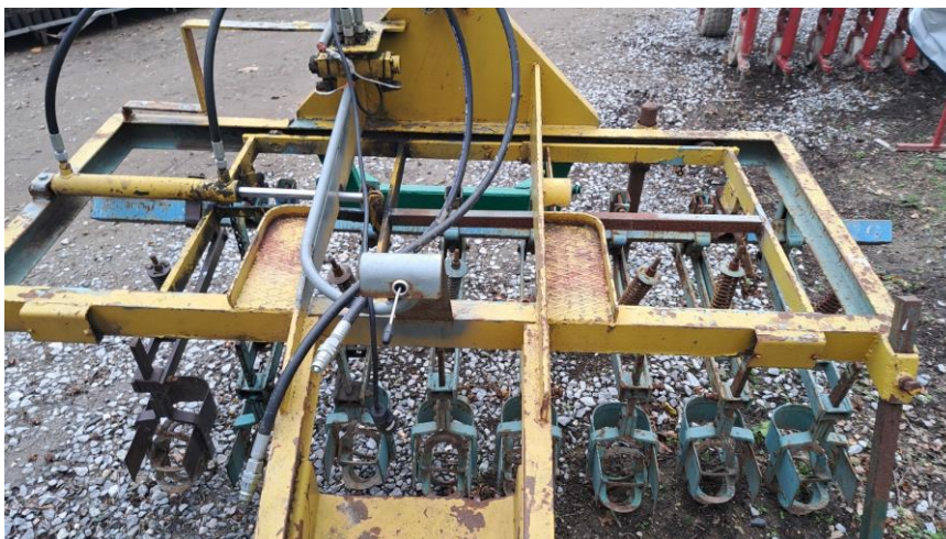
Obr. 4 Hydraulické jemné řízení vnútřního rámu plečky

posunu vnútorného rámu vŕči vnĕjšímu rámu. K zatáčení kol je pouŕita řídící tyč, kulové čepy a řídítka [5] nebo může být užito stejné principu, avšak řídící tyč a řídítka jsou nahrazeny přímočarým hydromotorem je jednotkou orbitol [9; 12]. Hydraulické jemné zatáčení je vyobrazeno na Obr. 2. V současné době existuje i řešení, kdy se vnútřní pracovní rám pohybuje uvnitř vnĕjšího pracovního rámu za pomoci přímočarého hydromotoru, viz Obr. 4.